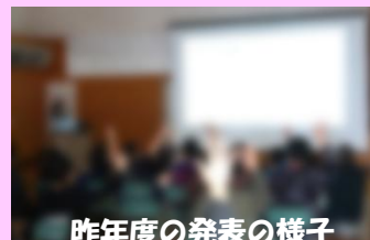
昨年度の発表の様子

子供たちが発表する姿をぜひたくさんの方にご覧いただきたいので、これを機会にお気軽に学校まで足をお運びください。